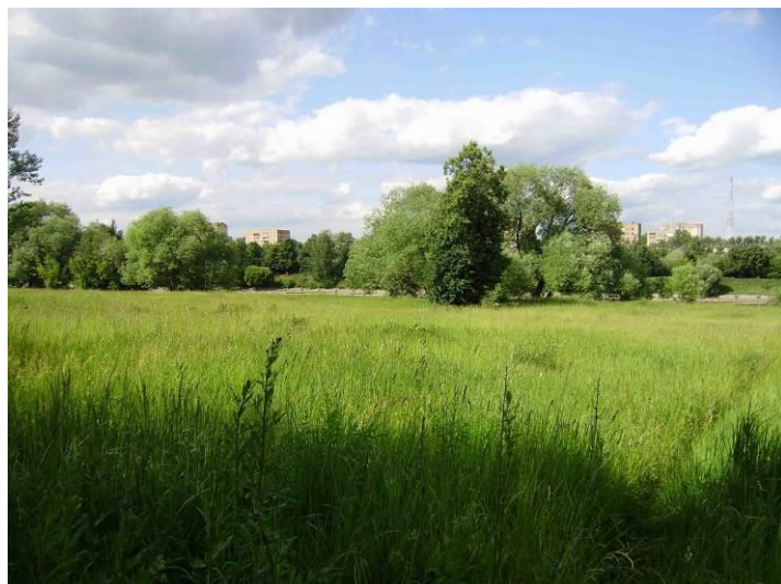
справа Центральный м/р (дома за дамбой и озером)