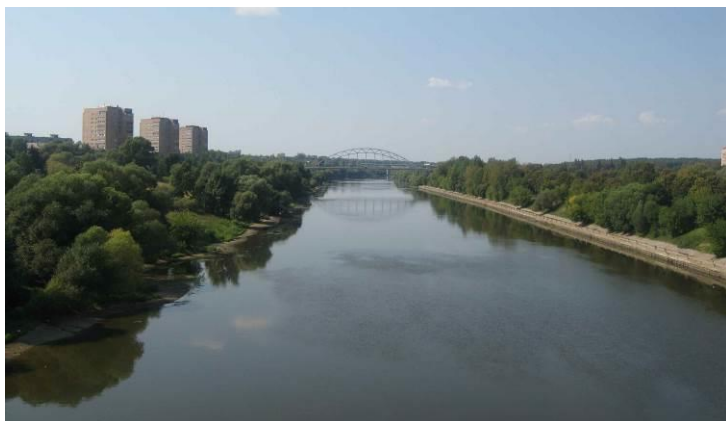
Слева Новлянский м/р,