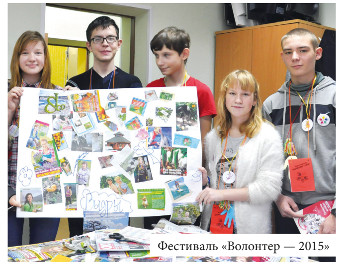
Фестиваль «Волонтер — 2015»