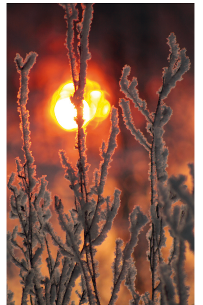
Фото «Солнце зимнее» сделано морозным вечером в окрестностях Воскресенска. И сегодня оно как нельзя лучше отражает мечту каждого из нас о заснеженных улицах и покрытых инеем ветках деревьев.