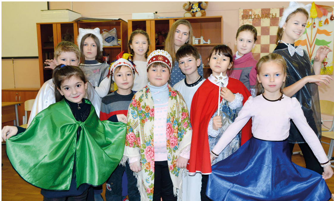
Младшая группа студии «Аномалия» на репетиции новогоднего спектакля