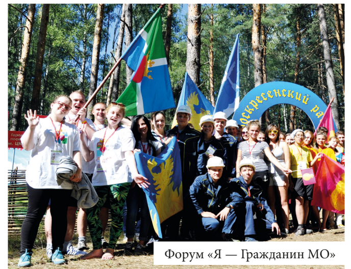
Форум «Я — Гражданин МО»

Какое счастье, что есть возможность принимать участие в добрых делах и интересных начинаниях, которых в этом году было так много! Каждый городской молодежный проект — бесценный опыт для всех его участников!