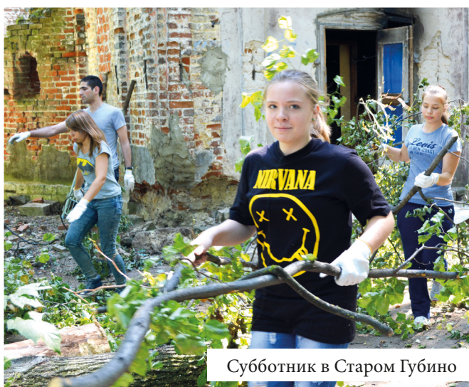
Субботник в Старом Губино