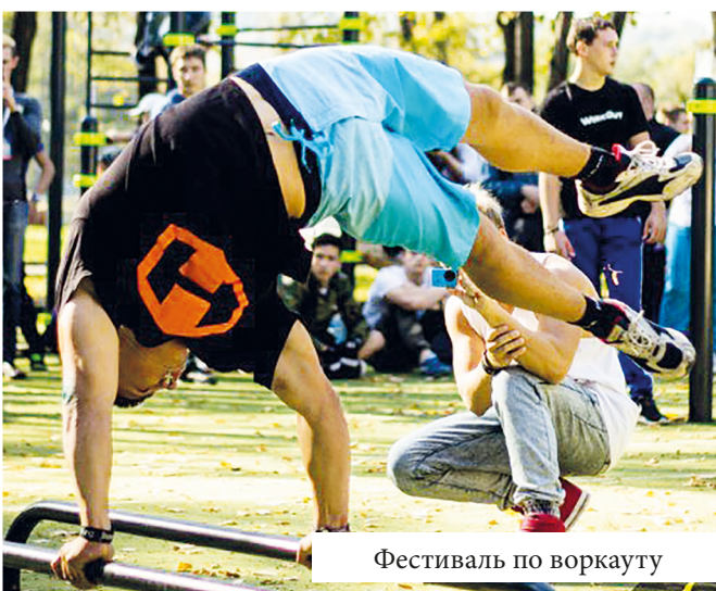
Фестиваль по воркауту