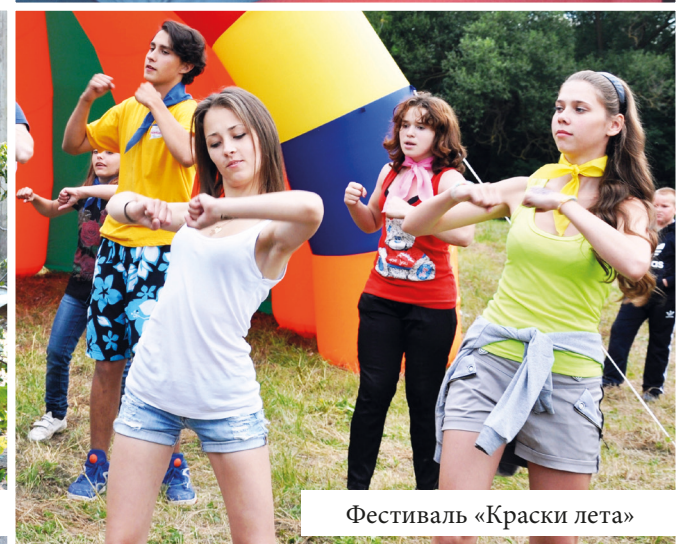
Фестиваль «Краски лета»