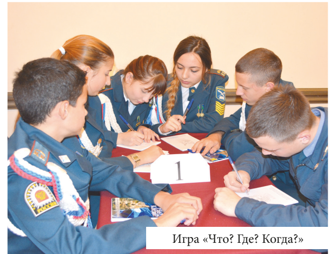
Игра «Что? Где? Когда?»