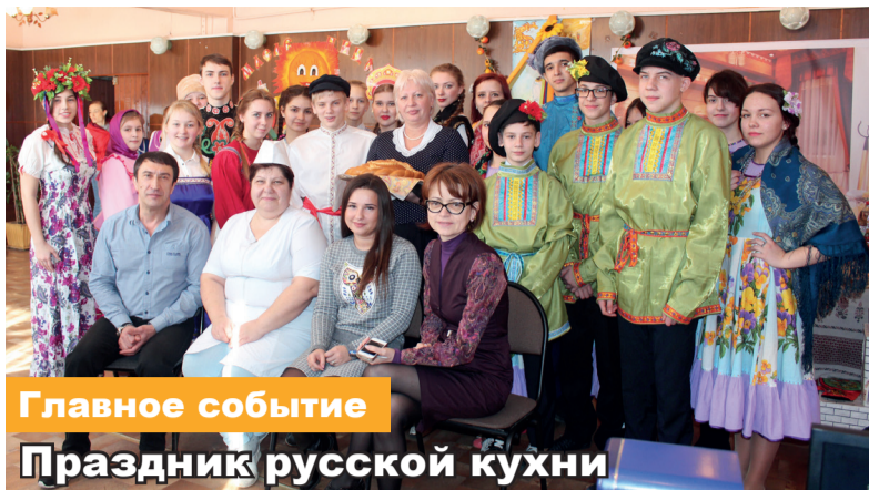
Главное событие Праздник русской кухни