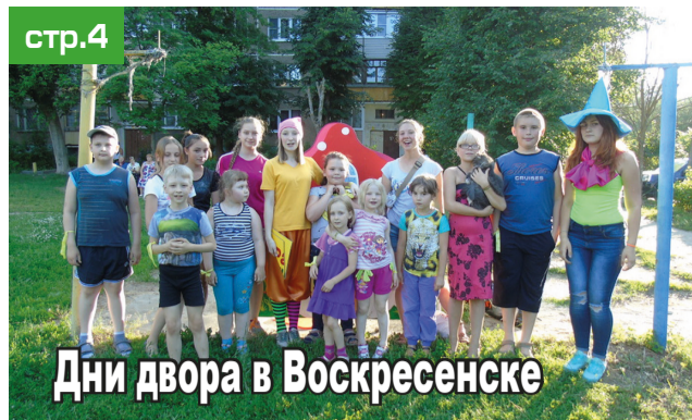
Дни двора в Воскресенске